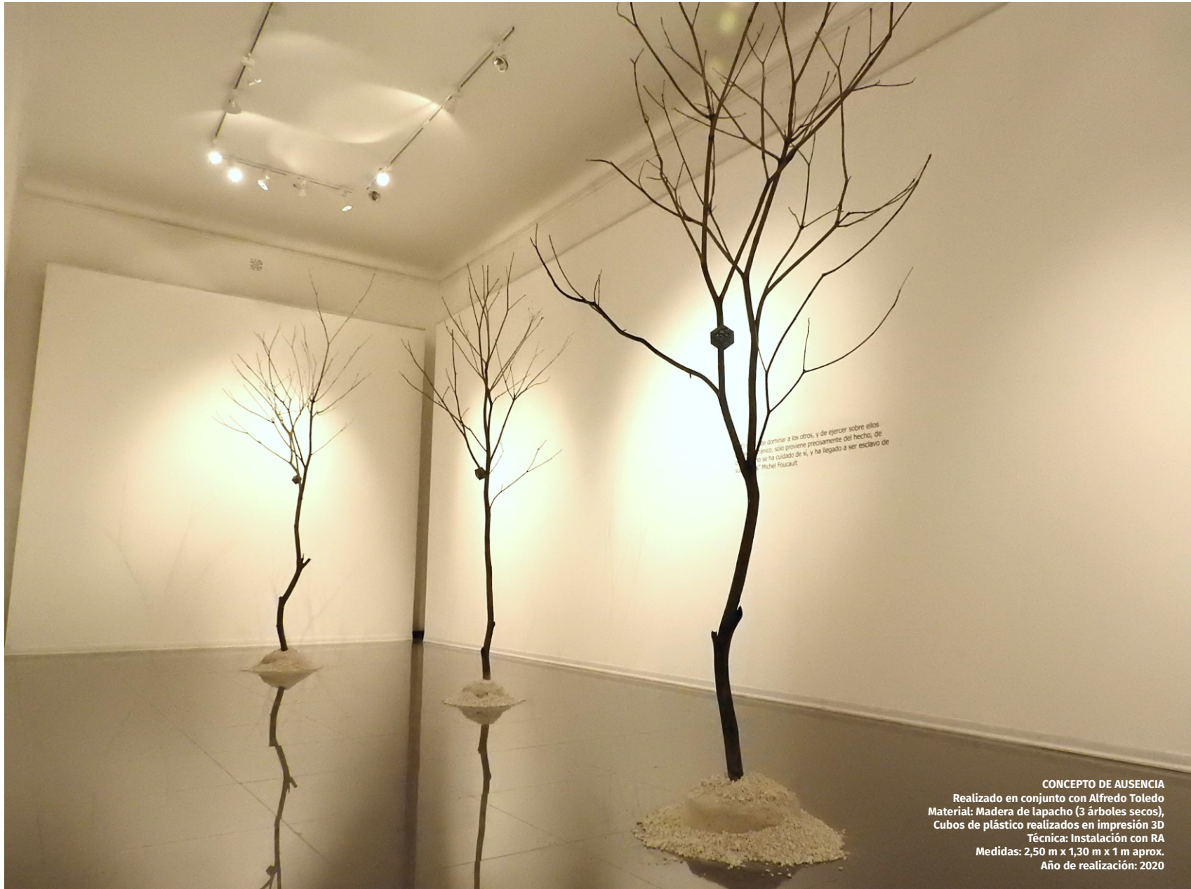
CONCEPTO DE AUSENCIA Realizado en conjunto con Alfredo Toledo Material: Madera de lapacho (3 árboles secos), Cubos de plástico realizados en impresión 3D Técnica: Instalación con RA Medidas: 2,50 m x 1,30 m x 1 m aprox. Año de realización: 2020