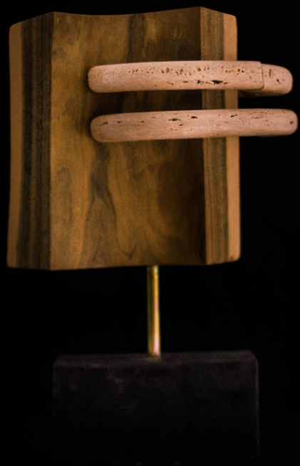
CONCIENCIA EXPANDIENDOSE Material: Madera de palo Santo y Travertino Técnica: Construcción Medidas: 0,30 m x 0,20 m x 0,20 m Año de realización: 2020