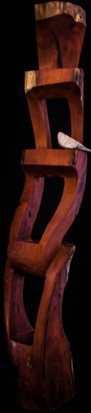
Nombre de la obra: RELATO ONÍRICO Material: Madera de algarrobo Técnica: Talla Medidas: 1,80 m x 0,40 m x 0,45 m