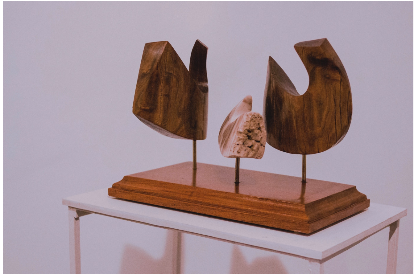
NÚCLEO Material: Madera y piedras semipreciosas de Ojuela Técnica: Construcción Medidas: 0,43 m x 0,30 m x 0,17 m Año de realización: 2019