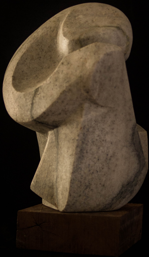
INTROSPECCIÓN Material: Mármol Técnica: Talla Medidas: 0,40 m x 0,25 m x 0,23 m Año de realización: 2020