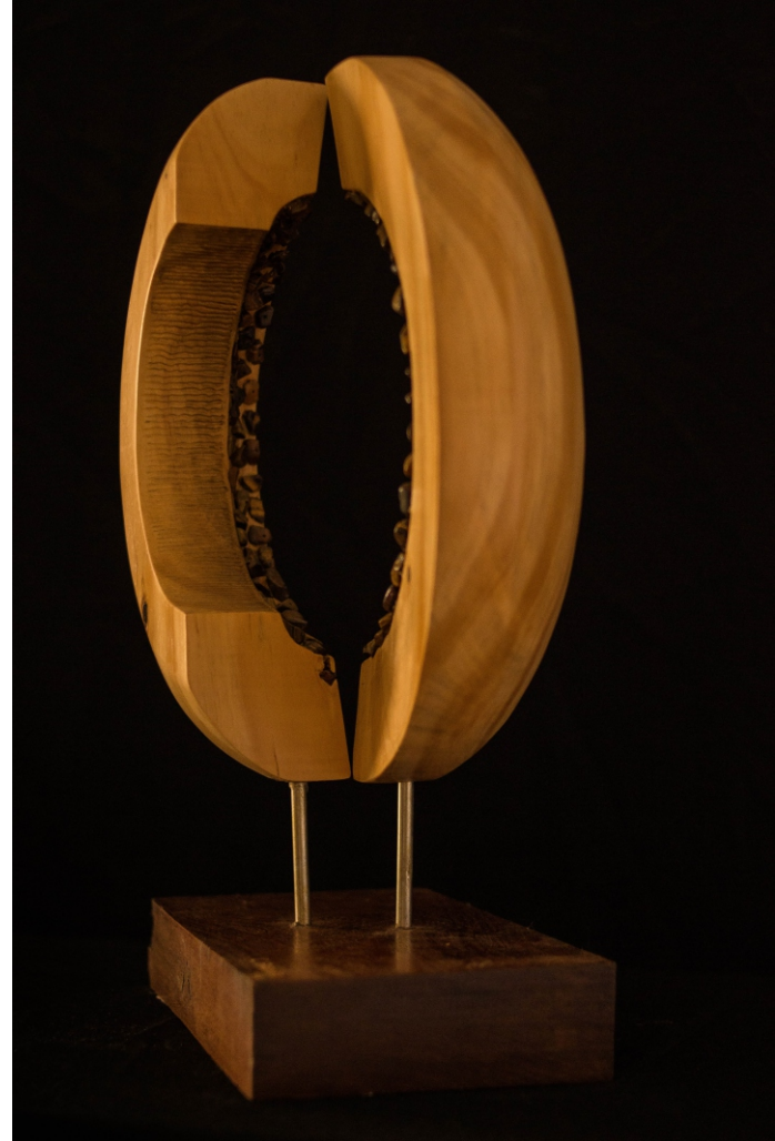
NÚCLEO Material: Madera y piedras semipreciosas de Ojuela Técnica: Construcción Medidas: 0,43 m x 0,30 m x 0,17 m Año de realización: 2019