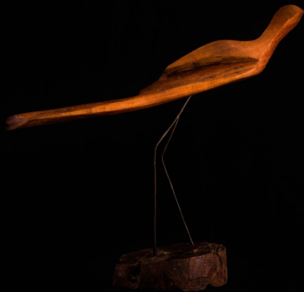
CHUÑA Material: Madera de algarrobo Técnica: Talla Medidas: 0,40 m x 0,30 m x 0,10 m Año de realización: 2019