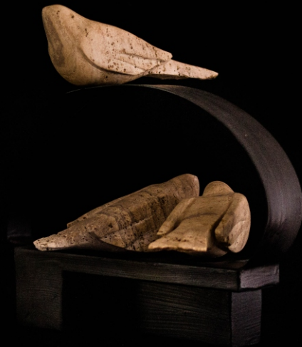
PALOMA, APRENDIENDO A VOLAR Material: Travertino y metal Técnica: Construcción Medidas: 0,30 m x 0,17 m x 0,43 m Año de realización: 2020