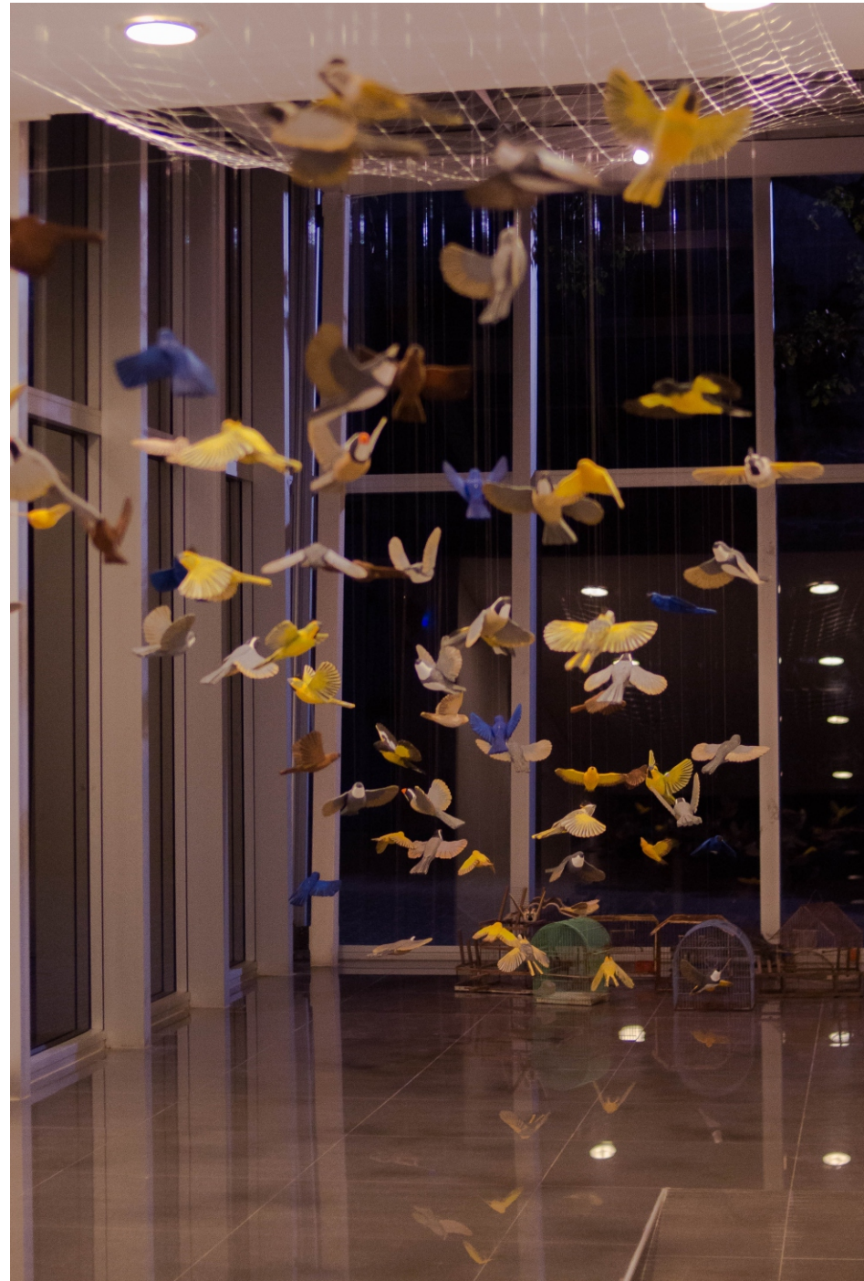
¡VUELA LIBRE! (instalación) Material: Madera de palmera- Telgopor Técnica: Talla - Construcción Medidas: Medidas varias Año de realización: 2020 Instalación sonorizada por Soledad Toledo