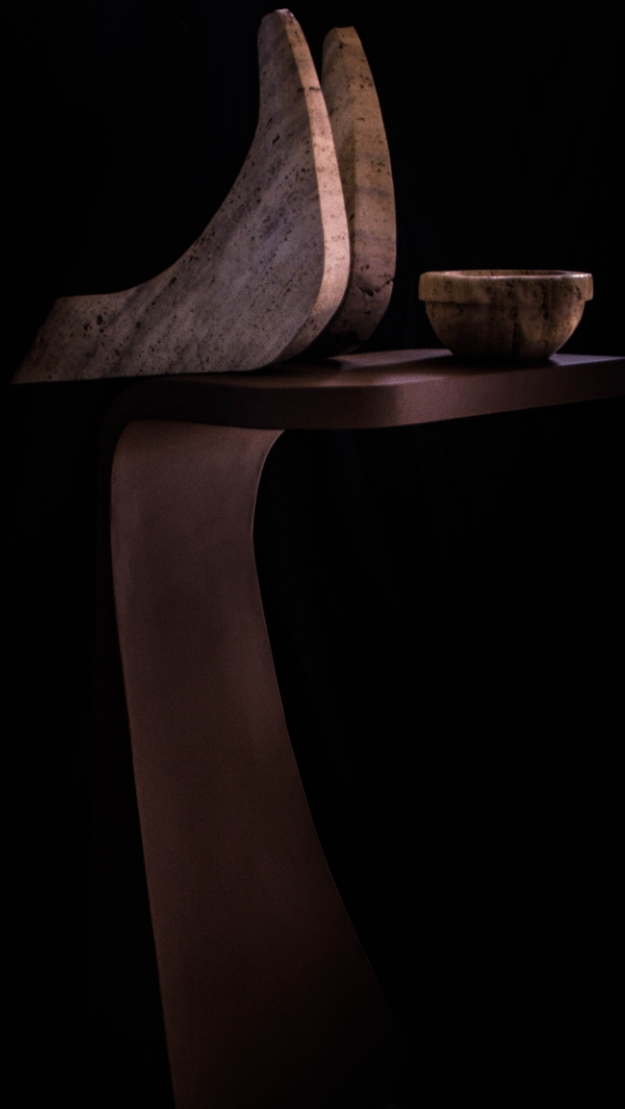
¡VUELA LIBRE! (instalación) Material: Madera de palmera- Telgopor Técnica: Talla - Construcción Medidas: Medidas varias Año de realización: 2020