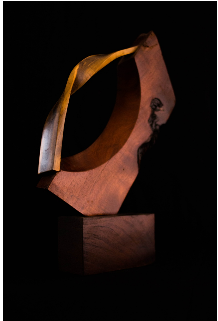
INSTRUMENTO DE CONEXIÓN Material: Madera de algarrobo y jarilla Técnica: Construcción Medidas: 0,35 m x 0,24 m x 0,10 m Año de realización: 2020